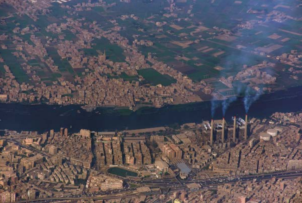
Gosto naseljena območja v Kairu, Egipt.