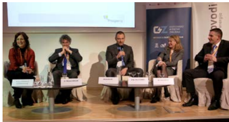
Omizje o razvoju energetskega trga in regulative 2017

Rezervirajte si 31. januar 2018 in se nam pridružite na 5. regulativnem forumu.