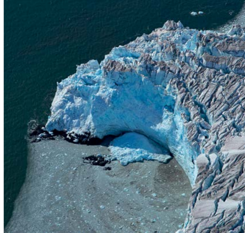
Ledeniki na Antarktiki.