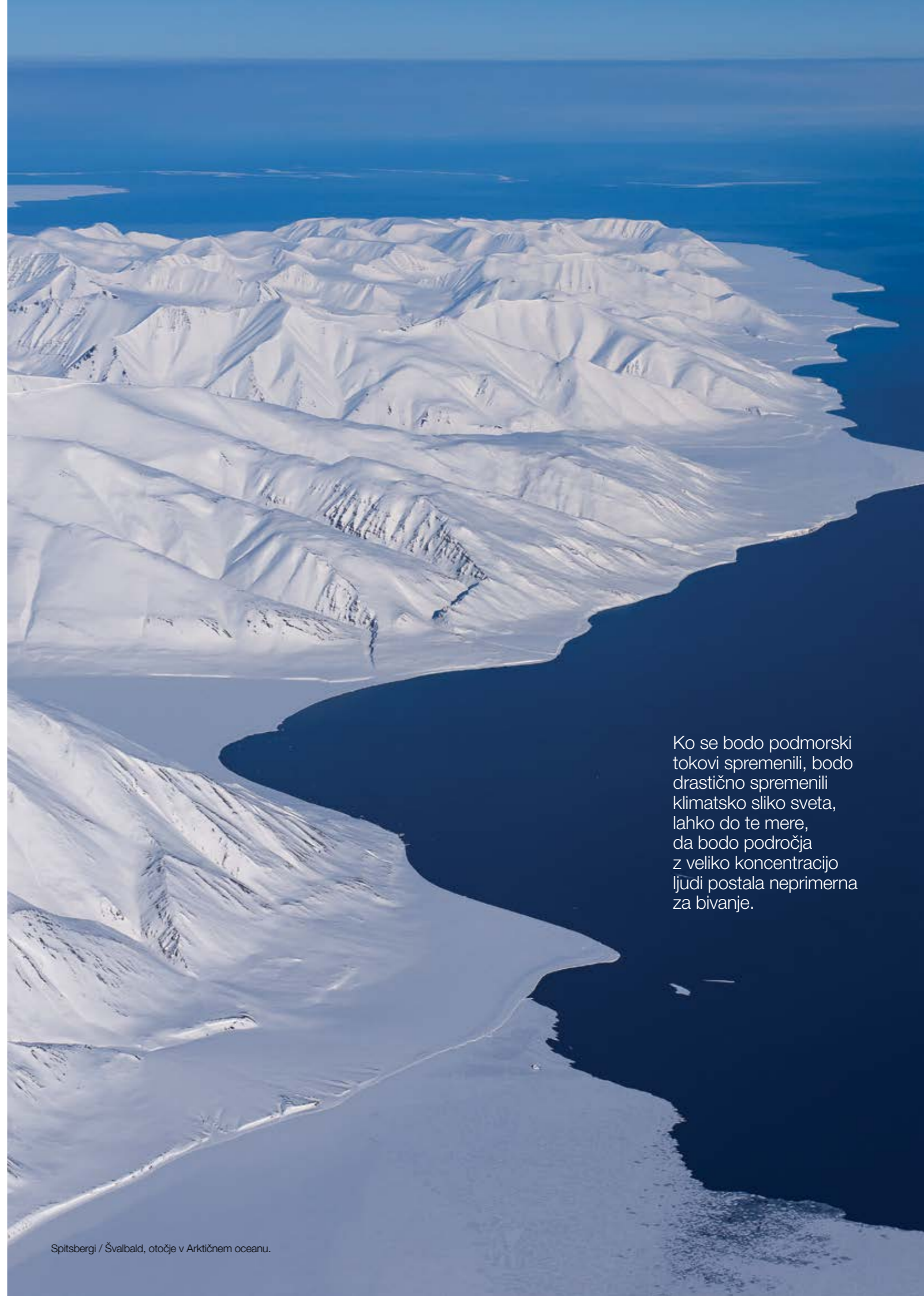
Spitsbergi / Švalbard, otočje v Arktičnem oceanu.

Logistično je bilo letos precej zapleteno, bistveno bolj kot prejšnja leta, saj smo vsak dan preverjali vreme in čakali na ciklon z dovolj močnimi južnimi vetrovi. Znotraj tega je bilo treba poiskati sprejem-